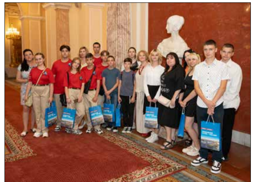
Серия публикаций о культурных, туристических и волонтерских событиях, проходящих в Санкт-Петербурге

Экскурсии по Мариинскому дворцу включают в себя информацию об истории и архитектурных достоинствах объекта культурного наследия федерального значения, о развитии парламентаризма в России, о структуре и деятельности Законодательного Собрания Санкт-Петербурга.